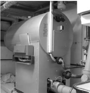
Der neue Heizkessel im Keller des Gemeindezentrums

Nach dem Einbau der neuen Heizung im Kindergarten versorgt uns nun auch im Gemeindezentrum eine neue Technik mit Wärme – und spart Abgase und Kosten. Für die optimale Feinabstimmung der Temperatur müssen wir uns noch etwas Zeit geben.