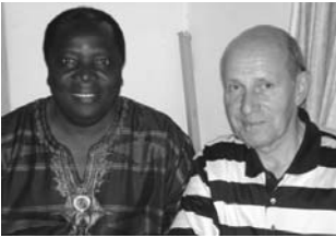
Begegnung in Makumira