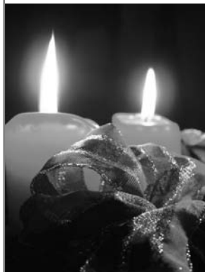
Ökumenischer Gemeinendachmittag am 6. Dezember, 14.30 in der Christuskirche