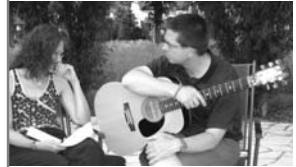
Kirchenmusik – auch ein Thema für den Kirchenvorstand