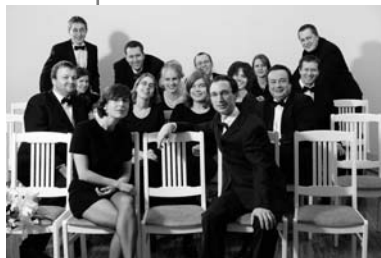
Das besondere Konzert zum Herbstfest: Die Lilienfelder Cantorei Berlin - Wege

Gottesdienst zum Erntedankfest mit Kindergottesdienst, anschl. erweiterter Kirchenkaffee bei Kaffee und Kuchen.